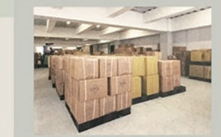
リポス・リネンサプライ製品センター 内部