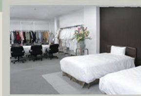
大阪本社 ショールーム