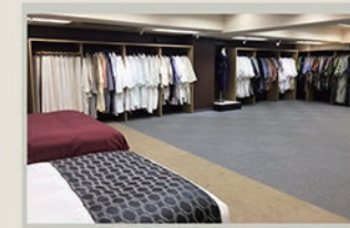
東京本部 ショールーム 2