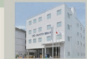
リポス・リネンサプライ製品センター